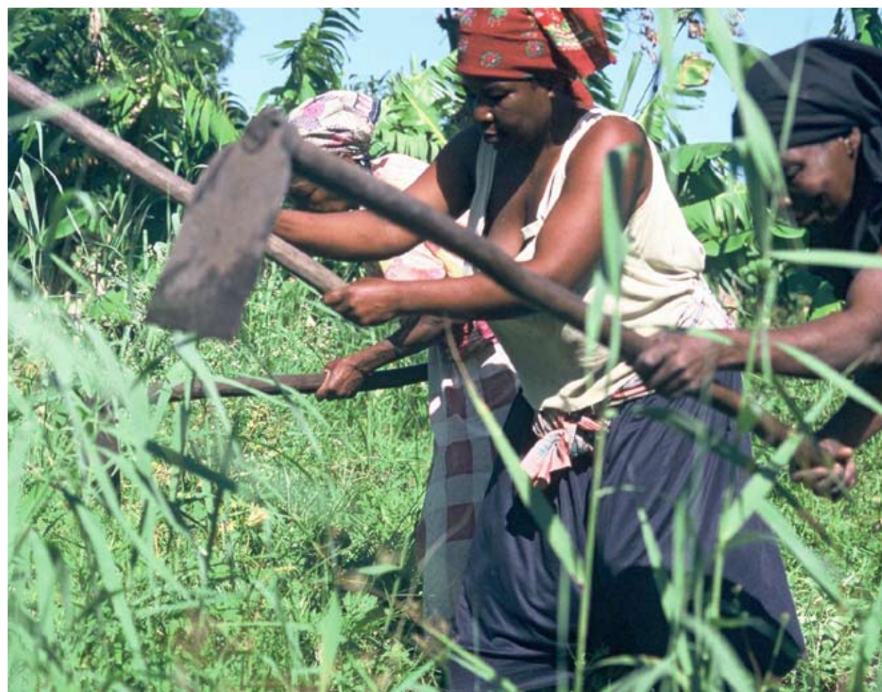
Gemeinschaftliche Arbeit in einer Frauenkooperative in Mosambik. Der Zugang zu Land ist für die Menschen in vielen Ländern Afrikas existenziell für ihre Ernährungssicherheit.

Landrausch Ausländische Investoren haben innerhalb von drei Jahren allein in Afrika 20 Millionen Hektar Ackerland aufgekauft. Während die lokale Bevölkerung an Hunger leidet, produzieren die Investoren Nahrungsmittel und Energiepflanzen für den Export.